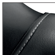
Protection de l'embout de sécurité avec encoche pour coutures