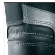
Système de maintien de la cheville HAIX® AF