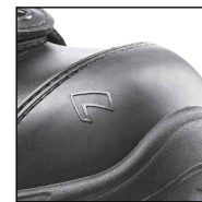
HAIX® Composite toe cap