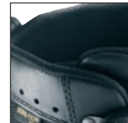
Fermeture de tige