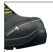
Coque de protection HAIX® en nanocarbonate